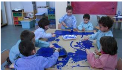
Coets pintant "Dissenys per a un quadre"

Una de les activitats que ens va agradar més va ser fer nosaltres mateixos un quadre. Els nens i nenes de la classe dels Sols ens el vam inventar utilitzant els colors i les formes que en Joan Miró feia servir. Els nens i nenes de la classe dels Coets vam reproduir un quadre anomenat "Disseny per a un quadre". Per uns instants, ens vam convertir en autèntics artistes. Si voleu veure les nostres obres d'art, us convidem a entrar al nostre mòdul.