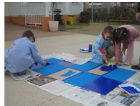
COLLAGE: EL CEL DE LA POLINÈSSIA