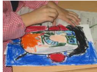
AUTORETRAT: MADAME MATISSE

A partir de l'autor hem reproduït les seves obres experimentant amb diferents tècniques com: l'autoretrat, l'estampació i el collage.