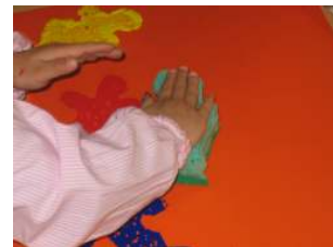
ESTAMPACIÓ: LA GARBA